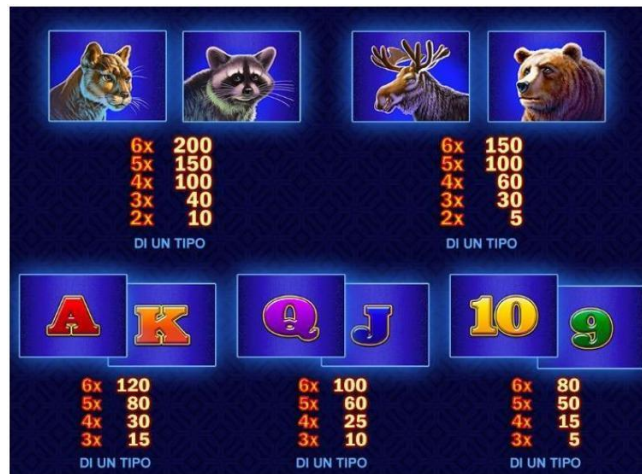
TABELLA DEI PAGAMENTI